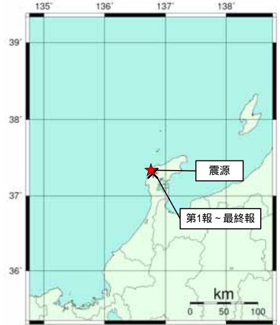
図: 推定した震源の位置