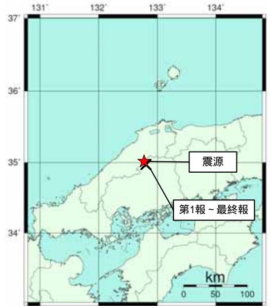
図: 推定した震源の位置