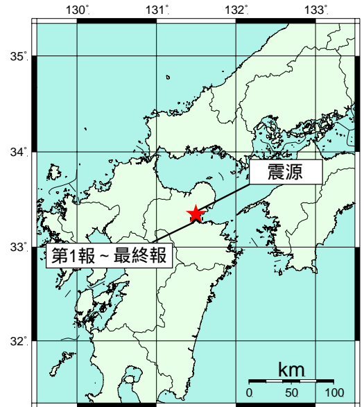
図: 推定した震源の位置