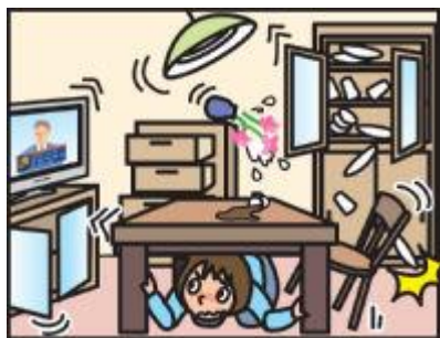
頭を守って、安全な場所に避難！

緊急地震速報を見聞きしたときの行動は、まわりの人に声をかけながら「周囲の状況に応じて、あわてずに、まず身の安全を確保する」ことが基本です。