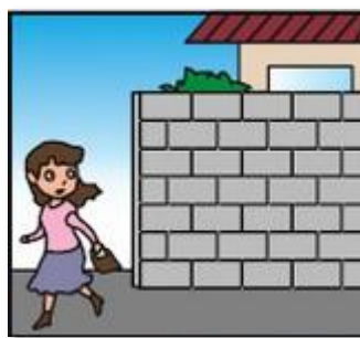
危ない場所から離れて！