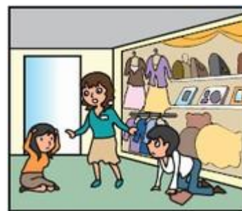
お店では、あわてず係員の指示に従って！