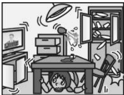
頭を守って、安全な場所に避難！

緊急地震速報を見聞きしたときの行動は、まわりの人に声をかけながら「周囲の状況に応じて、あわてずに、まず身の安全を確保する」ことが基本です。