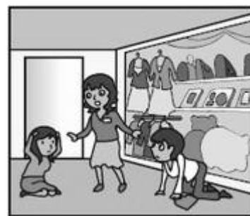
お店では、あわてず係員の指示に従って！