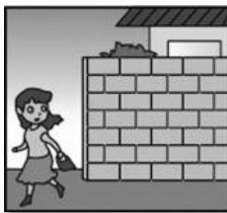
危ない場所から離れて！