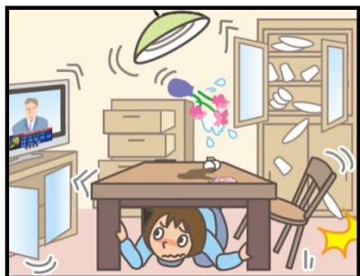
頭を守って、安全な場所に避難！

緊急地震速報を見聞きしたときの行動は、まわりの人に声をかけながら「周囲の状況に応じて、あわてずに、まず身の安全を確保する」ことが基本です。