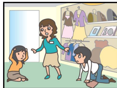
お店では、あわてず係員の指示に従って！