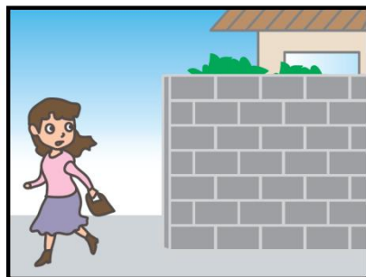
危ない場所から離れて！