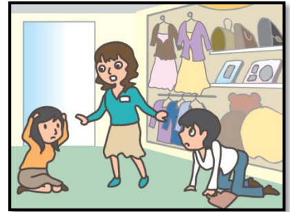
お店では、あわてず係員の指示に従って！