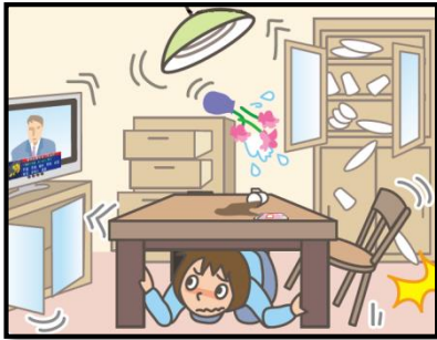
頭を守って、安全な場所に避難！

緊急地震速報を見聞きしたときの行動は、まわりの人に声をかけながら「周囲の状況に応じて、あわてずに、まず身の安全を確保する」ことが基本です。