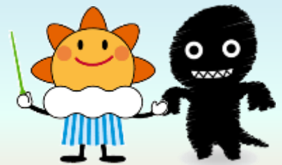
気象庁マスコットキャラクター「はれるん」 シェイクアウトキャラクター「シェイククエイク」