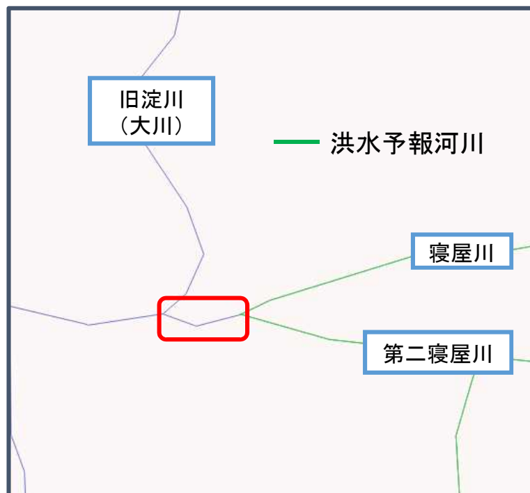
現在提供しているファイル