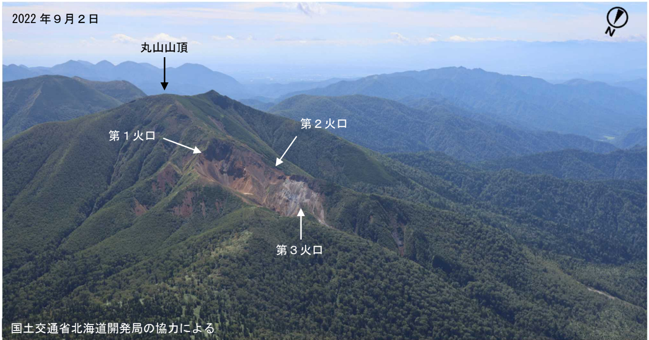
図2 丸山 北西斜面に位置する火口列の状況 北西側上空（図1の①）から撮影 ・第1火口～第3火口に噴気は認められませんでした。