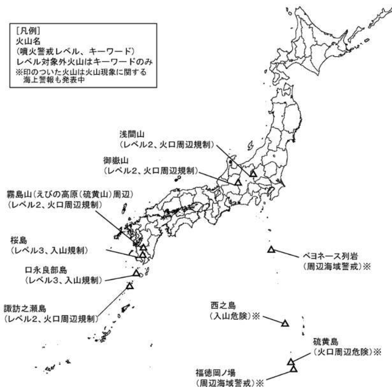
図 1 火山現象に関する警報を発表中の火山 (6 月 29 日現在)

この資料は気象庁ホームページ ( http://www.data.jma.go.jp/svd/vois/data/tokyo/volcano.html ) にも掲載しています。