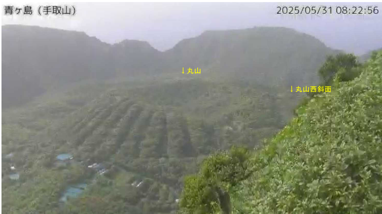
図1 青ヶ島 丸山周辺の状況（5月31日 手取山監視カメラによる）